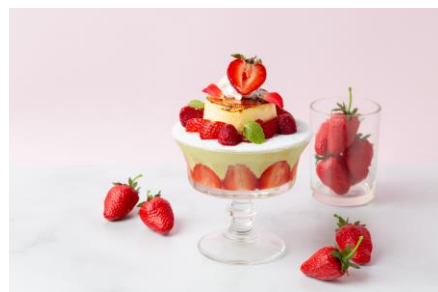
「パフェ&ジェラート ラルゴ」オリジナルパフェを作ろう！

「パスファインダー タイムスノブ」…かわい動物を描こう！親子一緒にラテアート体験 「パパブレ」…キャンディ カット体験 「ベーグル&ベーグル」…オリジナルベーグルサンドをつくらう！